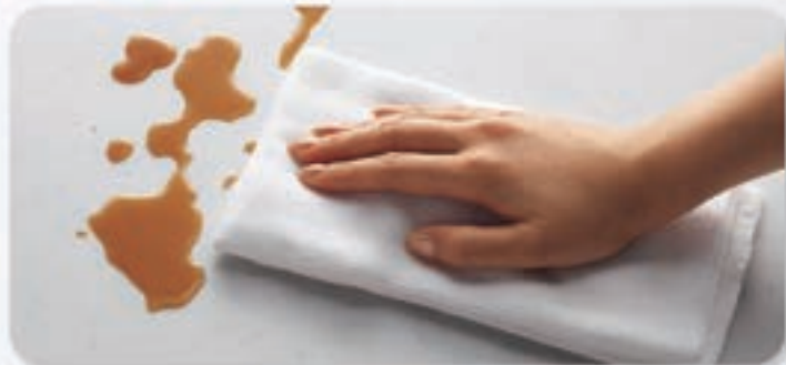
▶ 鑄角或其他接合處，或是表面經研磨處理後無法保有原耐污性能。

清潔容易、不留痕跡，以廚房常使用的用品，如：調味料、沙拉油、食醋、中性洗劑，放置24小時後，以水及洗劑擦拭，進行測試。