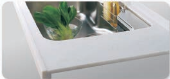
▶ 一體成形特色僅用D650深度。▶ D600深度檯面背牆無一體成形。

開模一體成形的背牆及止水邊條設計，強度及耐用度優於一般透過接著劑黏合打磨而成的人造石檯面，能使湯汁及污水不向地板溢流。